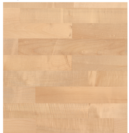
Sockelleiste: 16.61.5, 16x60 mm; permaDur