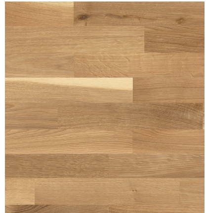
Sockelleiste: 16.61.1, 16x60 mm; naturaLin plus