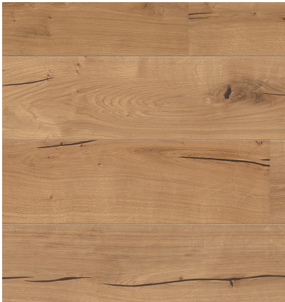
Sockelleiste: 16.61.44, 16x60 mm; naturaLin plus