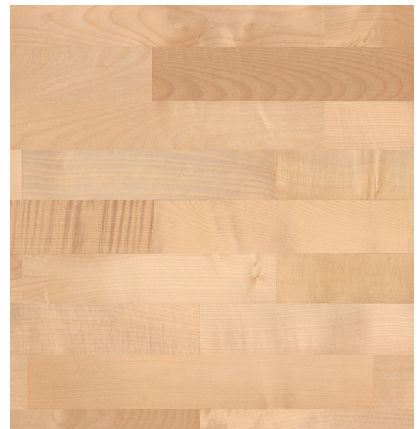
Sockelleiste: 16.61.2, 16x60 mm; permaDur