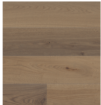
Sockelleiste: 16.61.49, 16 x 60 mm; naturaLin plus