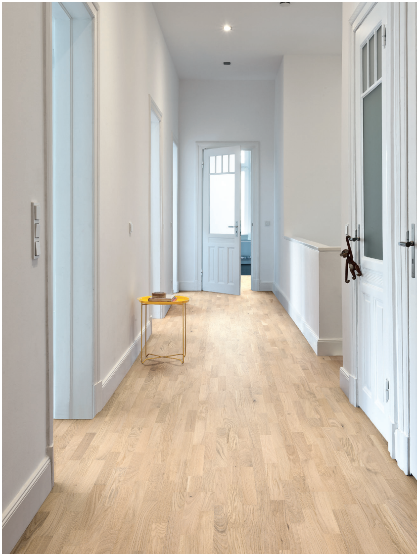
Schiffsboden 3-Stab 534804 | Eiche lichtweiß vario strukturiert