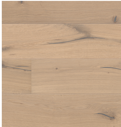
Sockelleiste: 16.61.37, 16x60 mm; naturaLin plus