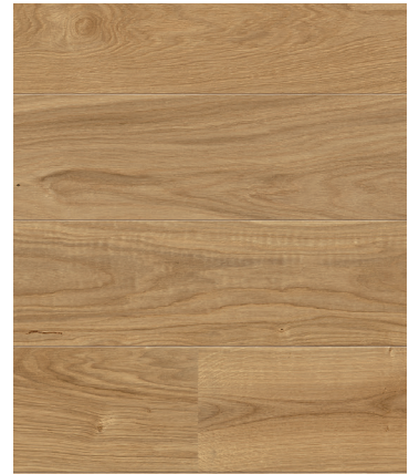
Sockelleiste: 16.61.44, 16x60 mm; naturaLin plus