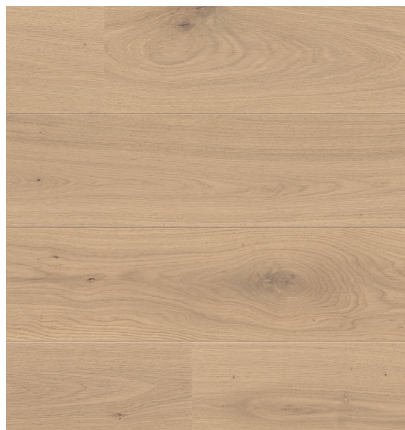
Sockelleiste: 16.61.36, 19x58 mm; permaDur