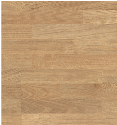
Sockelleiste: 16.61.1, 16x60 mm; permaDur