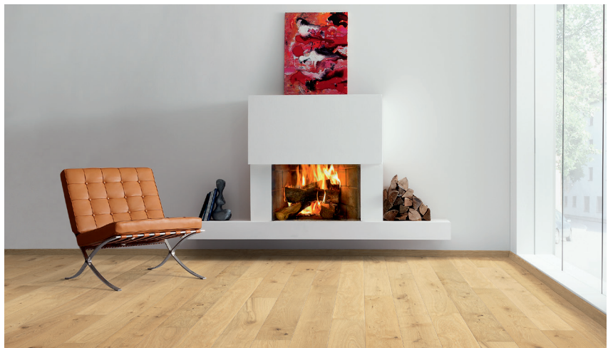
Landhausdiele 2V 534814 | Eiche vario strukturiert