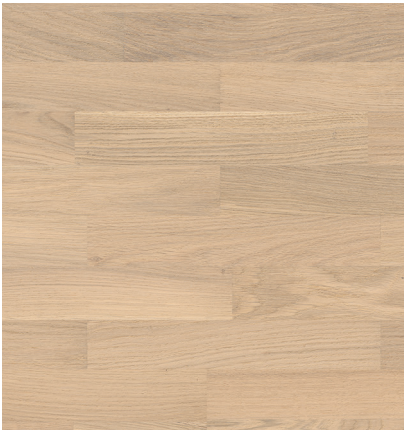
Sockelleiste: 16.61.36, 16x60 mm; permaDur