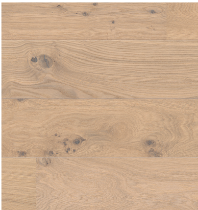
Sockelleiste: 16.61.37, 16x60 mm; naturaLin plus