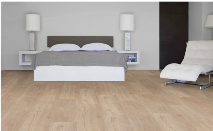
D1320-7009 Soft Oak Beige