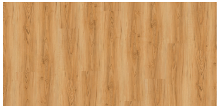
Sockelleiste: EP60 - 2360