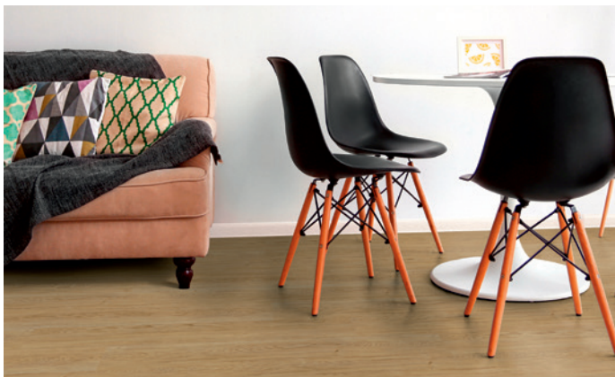
D1201-4499 Golden Oak