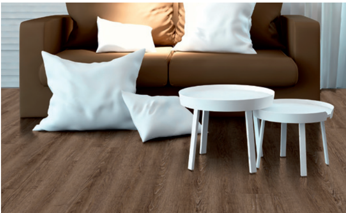
D1310-3472 Vintage Oak Brown