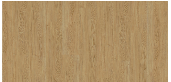
Sockelleiste: EP60 - 2567