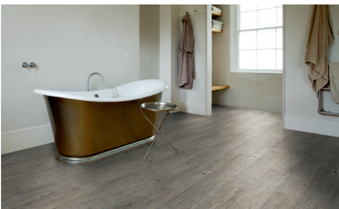
D1201-4479 Country Plank Grey Stained