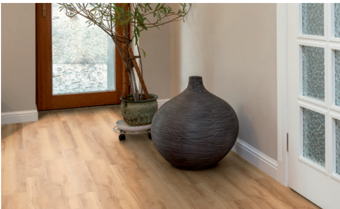
D1305-3030 Fruit Wood