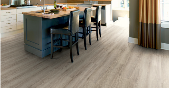
D1310-3474 Vintage Oak Grey