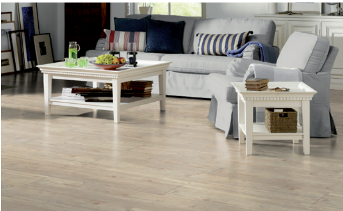
D1321-7005 Washed Pine Beige