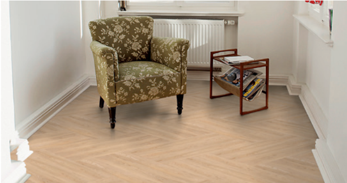
D1201-4478 Scandinavian Country Plank