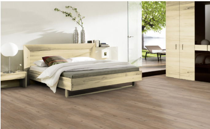
D1320-7010 Soft Oak Light Grey