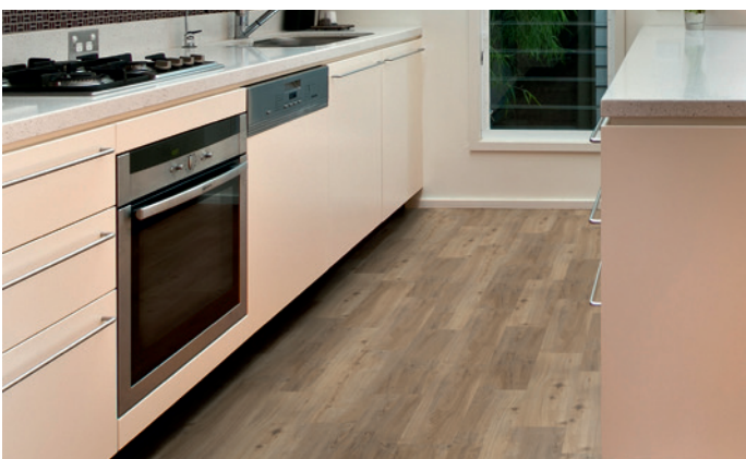
D1305-3025 Classic Oak Waxed