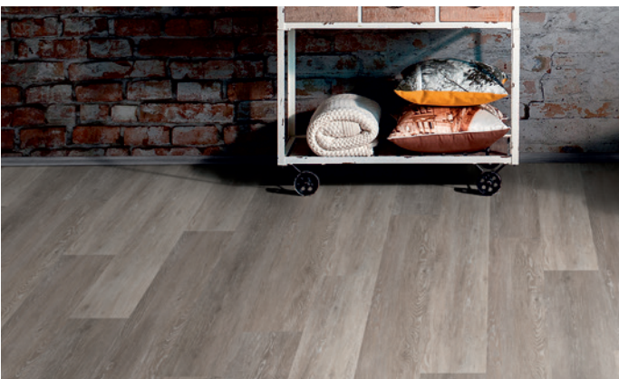
D1310-3037 Limed Oak Greyish