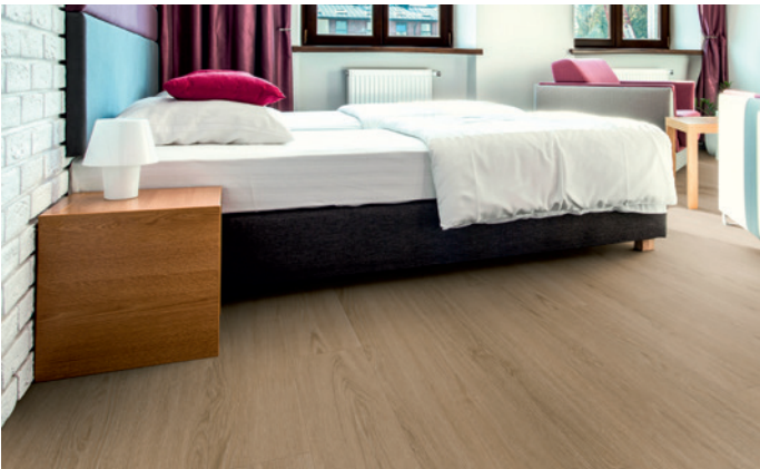
D1310-3492 Limed Oak Honey