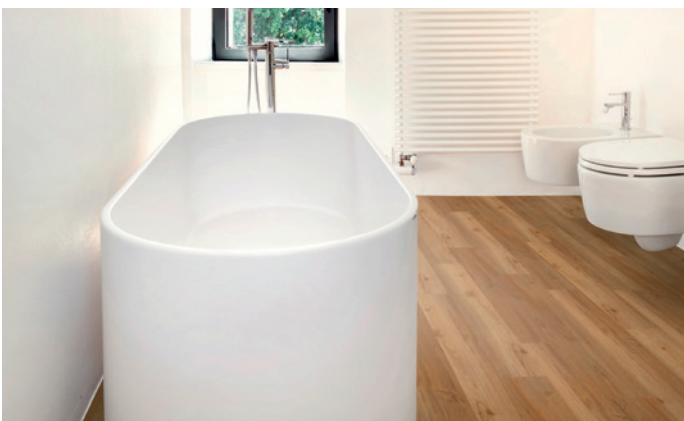
D1305-3032 Classic Oak