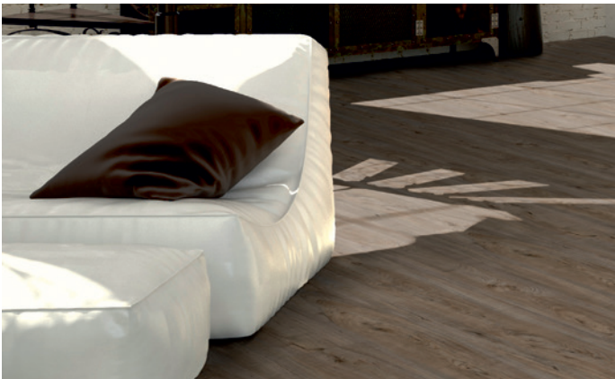
D1310-3485 Salted Oak