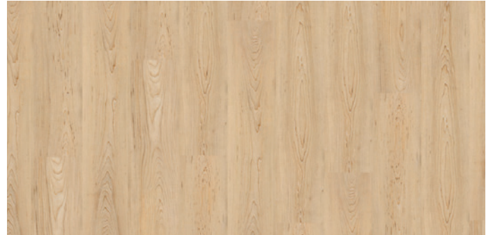
Sockelleiste: EP60 - 2358