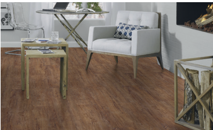
D1321-7002 Country Oak Natural