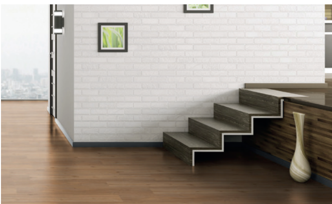
D1320-7012 Soft Oak Light Brown