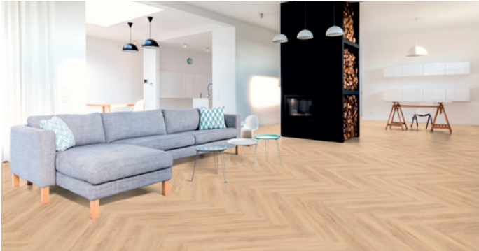
D1305-3029 Lakeshore Beach