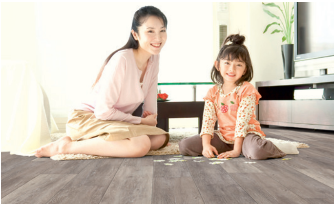
D1321-7010 Cerused Oak Light Brown