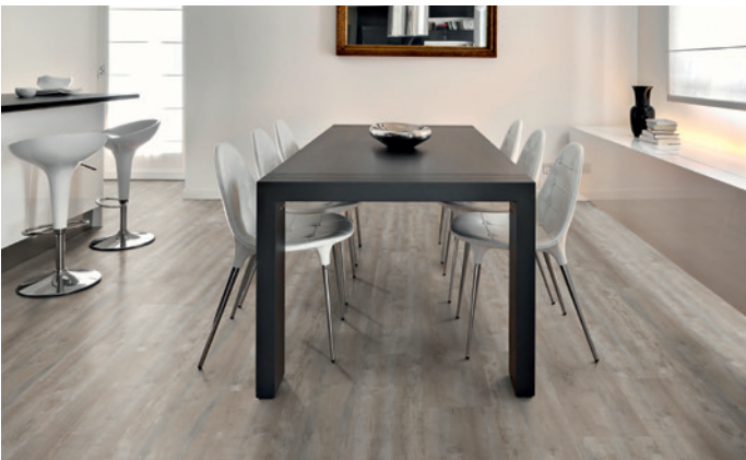
D1310-3488 Drift Wood Grey