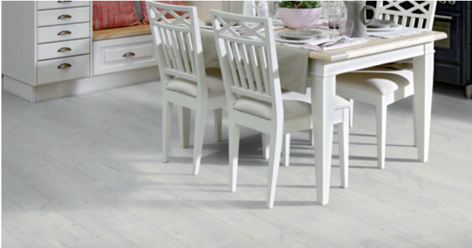
D1321-7007 Washed Pine Snow