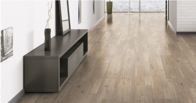
D1320-7015 Soft Oak Light Beige