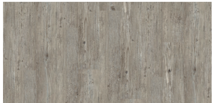
Sockelleiste: EP60 - 2357