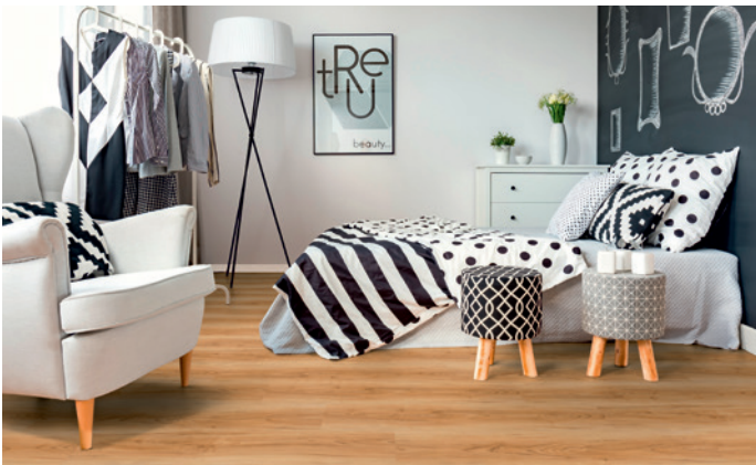
D1201-4473 Heart Fruit Tree Light