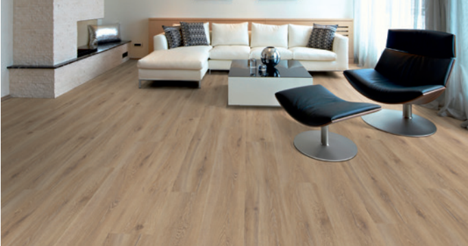
D1310-3496 Nordic Oak Honey