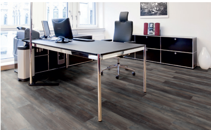
D1310-3504 Washed Pine Dark